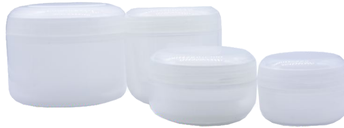
Tarro Blanco con Tapa y Linner Separado